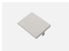
132-50100, B koncovka