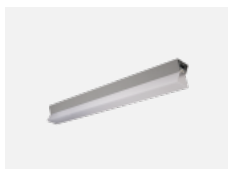
132-50031, B tubus závěsný 1000 mm