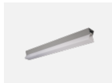
132-50031, W tubus závěsný 1000 mm