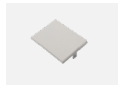
132-50100, W koncovka