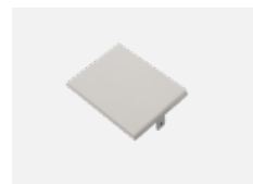
132-50100, S koncovka