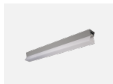
132-50031, S tubus závěsný 1000 mm