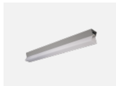
132-50031, W tubus závěsný 1000 mm