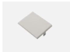
132-50100, W koncovka