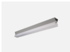
132-50031, B tubus závěsný 1000 mm