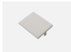
132-50100, B koncovka