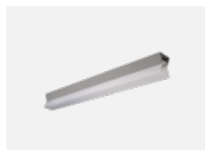
132-50031, W tubus závěsný 1000 mm