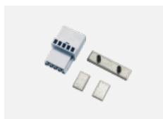
132-50200, F spoj přímý