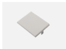
132-50100, S koncovka