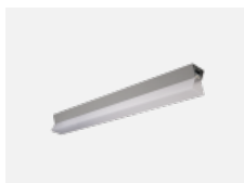
132-50031, S tubus závěsný 1000 mm