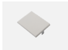
132-50100, B koncovka