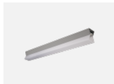
132-50031, B tubus závěsný 1000 mm