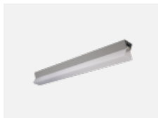
132-50031, W tubus závěsný 1000 mm