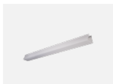
132-51100, K difuzor 2295 mm