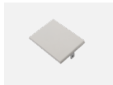
132-50100, W koncovka