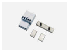
132-50200, F spoj přímý