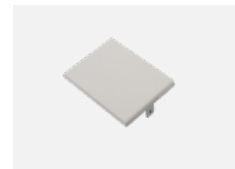
132-50100, W koncovka