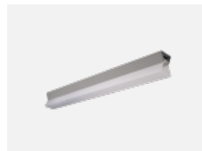
132-50031, W tubus závěsný 1000 mm