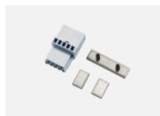
132-50200, F spoj přímý