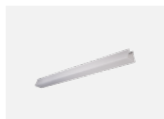
132-51100, K difuzor 2295 mm