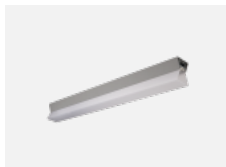
132-50031, S tubus závěsný 1000 mm