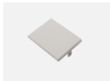
132-50100, S koncovka