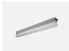
132-50031, W tubus závěsný 1000 mm