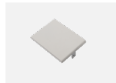
132-50100, W koncovka