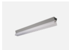
132-50031, S tubus závěsný 1000 mm