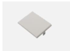
132-50100, S koncovka