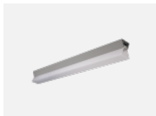
132-50031, W tubus závěsný 1000 mm