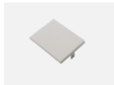
132-50100, W koncovka