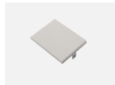
132-50100, W koncovka