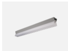
132-50031, W tubus závěsný 1000 mm