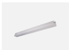
132-51100, K difuzor 2295 mm