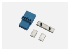
132-50201, F spoj přímý (pro stmívatelná sv.)