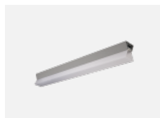
132-50031, S tubus závěsný 1000 mm