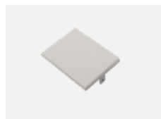
132-50100, S koncovka