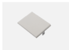
132-50100, B koncovka