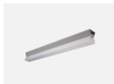
132-50031, B tubus závěsný 1000 mm