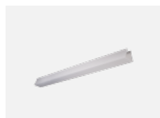
132-51100, K difuzor 2295 mm