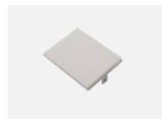
132-50100, S koncovka