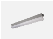
132-50031, B tubus závěsný 1000 mm