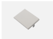
132-50100, B koncovka