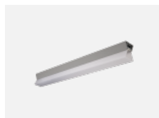
132-50031, B tubus závěsný 1000 mm