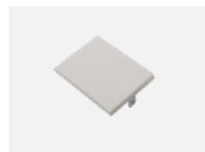
132-50100, B koncovka