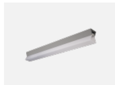
132-50031, B tubus závěsný 1000 mm