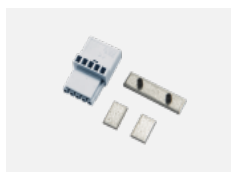
132-50200, F spoj přímý