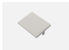
132-50100, W koncovka