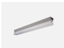
132-50031, W tubus závěsný 1000 mm