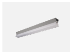
132-50031, W tubus závěsný 1000 mm