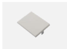
132-50100, B koncovka