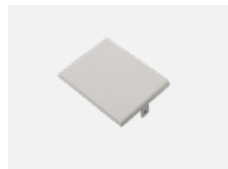
132-50100, B koncovka