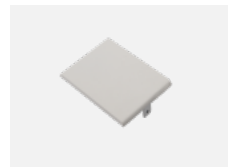
132-50100, W koncovka