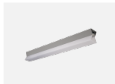
132-50031, W tubus závěsný 1000 mm