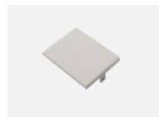
132-50100, B koncovka