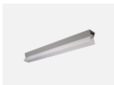
132-50031, B tubus závěsný 1000 mm