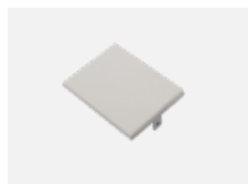
132-50100, B koncovka