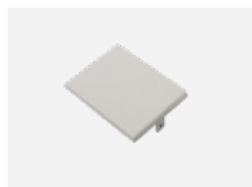
132-50100, W koncovka