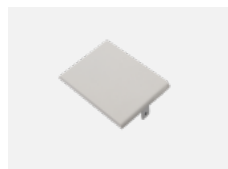
132-50100, W koncovka