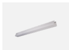
132-51100, K difuzor 2295 mm