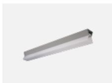
132-50031, W tubus závěsný 1000 mm