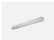
132-51100, K difuzor 2295 mm