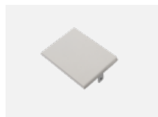
132-50100, B koncovka