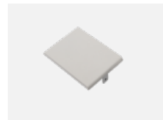
132-50100, W koncovka