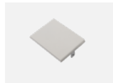
132-50100, S koncovka