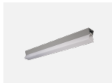
132-50031, S tubus závěsný 1000 mm