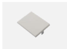
132-50100, W koncovka