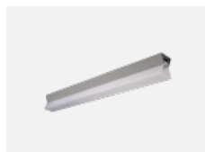
132-50031, W tubus závěsný 1000 mm