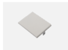
132-50100, B koncovka