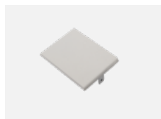
132-50100, W koncovka