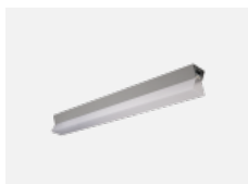
132-50031, W tubus závěsný 1000 mm