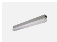
132-50031, B tubus závěsný 1000 mm