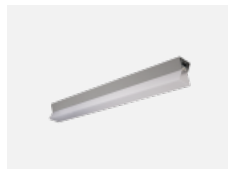
132-50031, B tubus závěsný 1000 mm