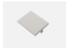
132-50100, B koncovka