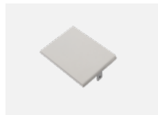
132-50100, B koncovka