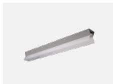
132-50031, B tubus závěsný 1000 mm