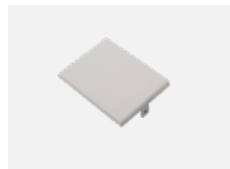
132-50100, W koncovka