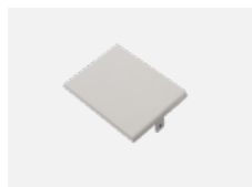
132-50100, S koncovka