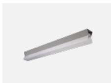
132-50031, S tubus závěsný 1000 mm