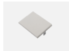
132-50100, B koncovka