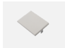
132-50100, B koncovka