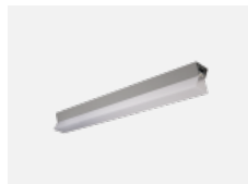
132-50031, B tubus závěsný 1000 mm