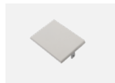
132-50100, W koncovka