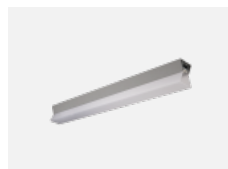
132-50031, W tubus závěsný 1000 mm