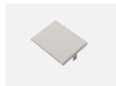
132-50100, W koncovka