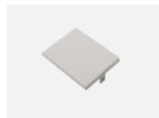
132-50100, S koncovka