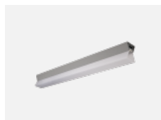
132-50031, S tubus závěsný 1000 mm