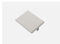
132-50100, S koncovka