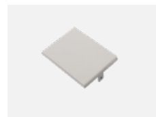
132-50100, B koncovka