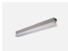
132-50031, B tubus závěsný 1000 mm