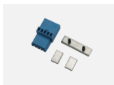
132-50201, F spoj přímý (pro stmívatelná sv.)