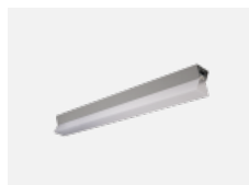
132-50031, W tubus závěsný 1000 mm