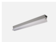
132-50031, S tubus závěsný 1000 mm