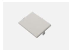
132-50100, B koncovka