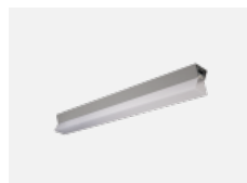
132-50031, B tubus závěsný 1000 mm