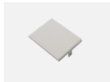
132-50100, S koncovka