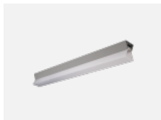
132-50031, S tubus závěsný 1000 mm