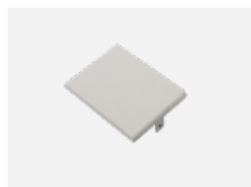
132-50100, B koncovka