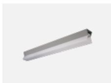
132-50031, B tubus závěsný 1000 mm